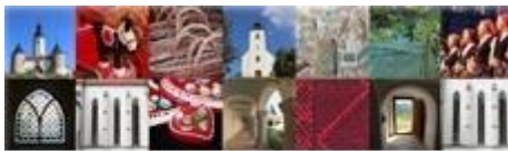
EUROPSKA GODINA KULTURNE BAŠTINE 2018.

Zainteresirani smo za provođenje odabranih programa u našem Vrtiću radi velikog interesa djece, njihove motiviranosti za aktivno sudjelovanje i izražavanje sredstvima glazbene i plesne umjetnosti. Istražujemo kulturnu baštinu našeg kraja radi jačanja osobnog, kulturnog i nacionalnog identiteta djece te radi aktualnosti sadržaja u 2018. godini koja je proglašena godinom europske kulturne baštine.